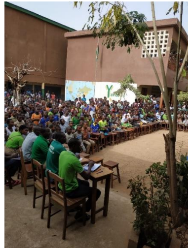
Semaine culturelle, mars 2019 : Débat sur les grossesses précoces en milieu scolaire