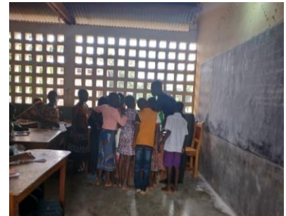
Cours de soutien

Depuis 2015, des cours de soutien axés sur les matières scientifiques sont financés en partie par Yanfouom France et en partie par les parents d'élèves. On constate petit à petit une amélioration du niveau.